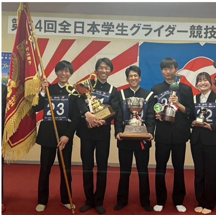
(↑団体優勝の慶應義塾大学)